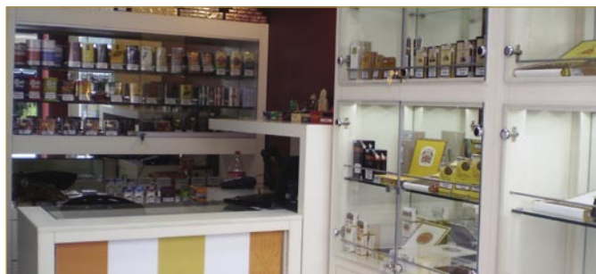
центъра на Благоевград — от април 2011

Зона за дегустация на кубински пури — пред хотел Radisson Blu, в новооткрития Open cigar bar на La Casa del Habano.