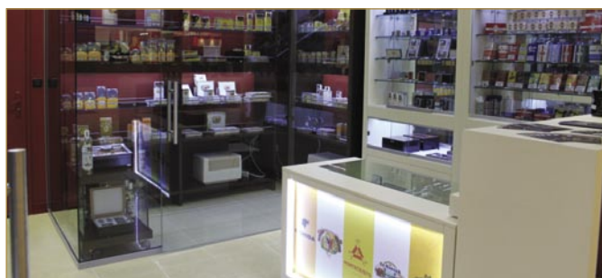
новооткрития Grand Mall Ruse — от май 2011